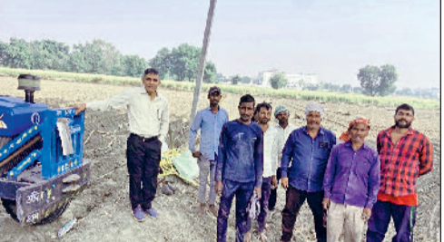
रोहतक। गन्ने की बुवाई करते किसान।