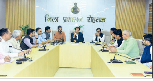
रोहतक। स्वच्छता अभियान तथा नगर सौंदर्यकरण कार्य योजना को लेकर अधिकारियों की बैठक लेते उपायुक्त सचिन गुप्ता।

डीसी ने कहा, मुख्यमार्गों का प्राथमिकता के आधार पर निरीक्षण किया जाए और इन मार्गों पर कोई भी गार्बेज वनरेबल पॉइंट (जीवीपी) ना हो। उन्होंने निर्देश दिए कि यह भी चेक किया जाए की घर-घर से कचरा उठाने वाली गाड़ियां सभी क्षेत्रों में पहुंचे