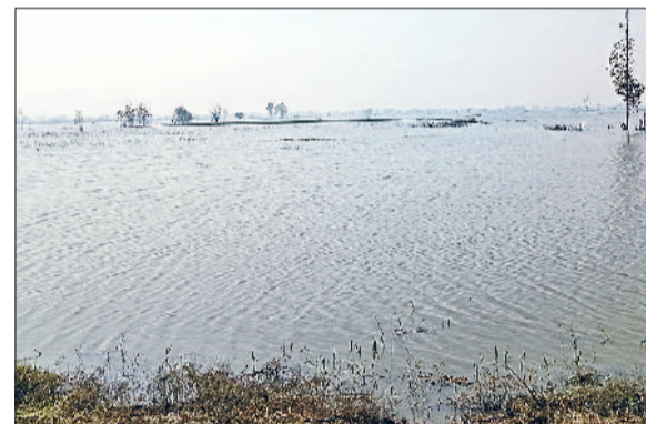
सैमाण-भैणी सुरजन गांव की सीमा पर खेतों में जमा बरसाती पानी।

एवं पंचायत व राजस्व विभाग के अधिकारियों के साथ महम खंड के गांवों बहलबा, भैणी चंद्रपाल, भैणी सुरजन, सैमाण, भैणी मातो, भैणी महाराजपुर व भैणी भैरों में खेतों में पहुंचकर जल निकासी का निरीक्षण किया तथा अधिकारियों