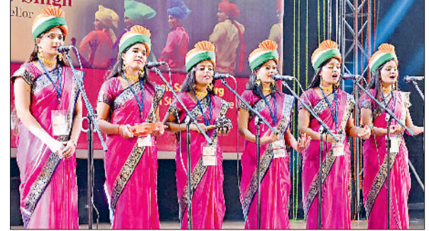
इंटर जोनल यूथ फेस्टिवल यूनीफेस्ट 2025 में अपनी प्रस्तुति देते प्रतिभागी।

सुजनशीलता का प्रदर्शन किया। प्रातः कालीन सत्र में प्रतिभागियों ने पोस्टर मेकिंग तथा मेहंदी लगाओ प्रतियोगिता में अपनी प्रतिभा दिखाई। स्वराज सदन में पाश्चात्य संगीत, एकल गायन तथा वादन की धूम रही। वहीं, साहित्यिक इवेंट्स में काव्य पाठ (हरियाणवी तथा पंजाबी) तथा