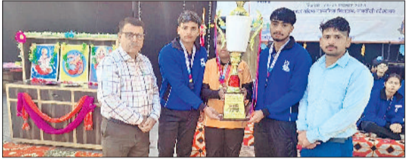
खिलाड़ियों को शुभकामनाएं दी

हरियाणा लैक्रोस एसोसिएशन द्वारा आयोजित तीसरी सीनियर स्टेट लैक्रोस चैम्पियनशिप में शिक्षा भारती विद्यालय, गोहाना रोड के विद्यार्थियों ने शानदार प्रदर्शन करते हुए तीसरा स्थान हासिल किया। यह प्रतियोगिता भंडारी गांव, जिला पानीपत में राज्य स्तर पर आयोजित की गई, जिसमें हरियाणा के 14 जिलों की टीमों ने भाग लिया। इस आयोजन का उद्देश्य युवाओं में खेल भावना, टीमवर्क और अनुशासन को प्रोत्साहित करना था। पूरे कार्यक्रम के दौरान खिलाड़ियों ने उच्चस्तरीय प्रदर्शन,