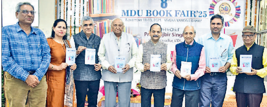
रोहतक। पुस्तक मेले में भाग लेते आयोजक व अतिथि लेखक।