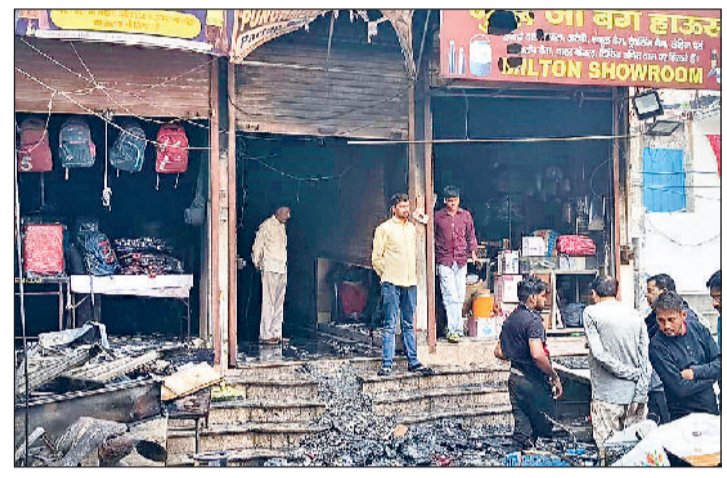
रोहतक। आग से नष्ट हुआ सामान को देखते दुकानदार।

धमाका इतना जोरदार था कि दुकान का शटर फट गया और अंदर रखा सारा सामान सड़क पर बिखर गया। आसपास की कई दुकानों के शटरों के परखच्चे उड़ गए, वहीं, एक घर की दीवारों में भी गहरी दरारें आ गईं।