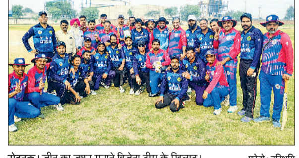
रोहतक। जीत का जश्न मनाते विजेता टीम के खिलाड़ी।