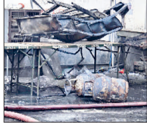
हरिभूमि न्यूज | रोहतक

फाइलें, दुकान में रखा सामान और शटर सब राख में तब्दील