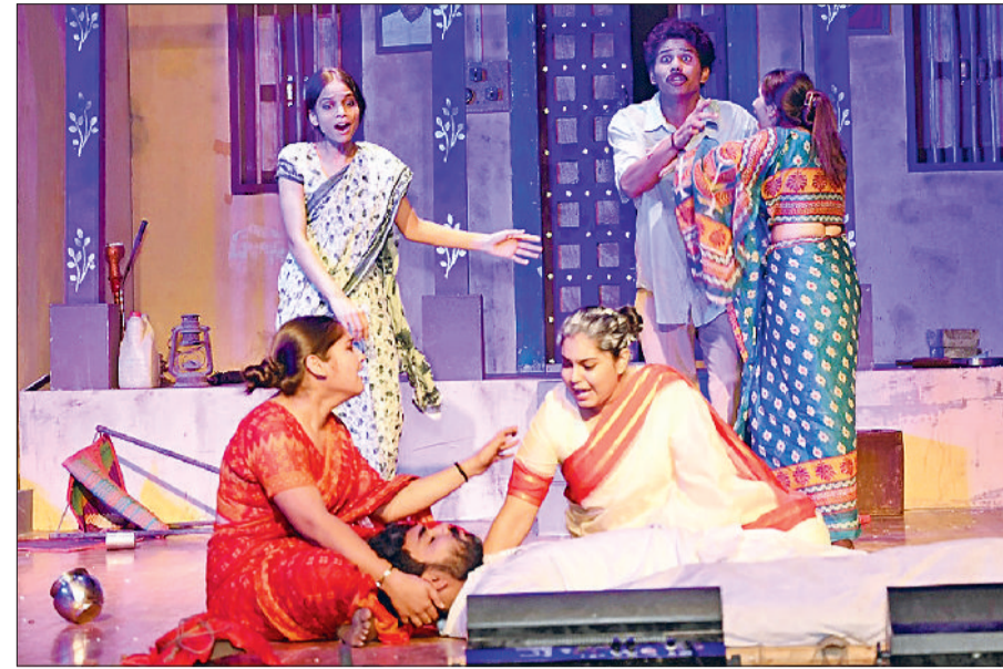
एमडीयू के राधाकृष्णन सभागार में आयोजित नाटक में भाग लेते प्रतिभागी।